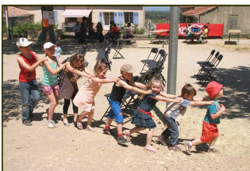
Le forum des associations,