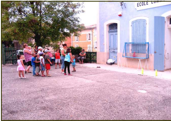
Soirée pizza, jeux des enfants lors de la fête...