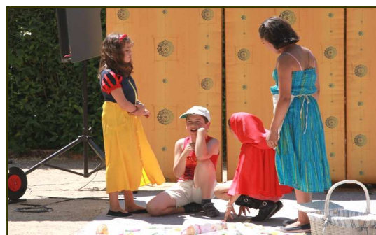
Le spectacle de théâtre...