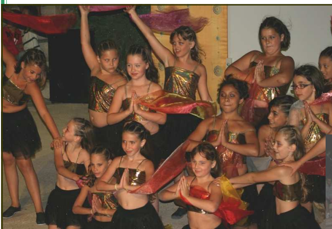
Le spectacle de danse ...